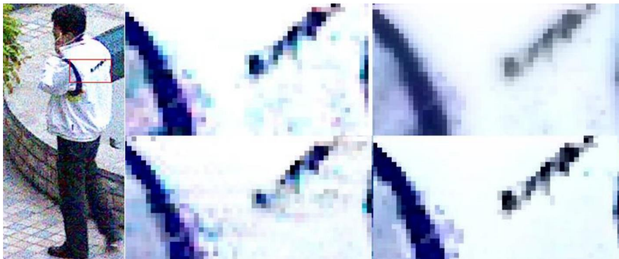
شکل ۲- جزئیات تصویر زوم شده

تصاویر در جهت ساعتگرد: تصویر اصلی، تصویر با فیلتر Spatial، تصویر با فیلتر Temporal، تصویر با فیلتر Motion Adaptive فیلتر Motion Compensation یک نسخه پیشرفته‌تر از فیلتر Motion Adaptive است و تکنولوژی‌های فیلتر Spatial و Temporal را در هم می‌آمیزد و یک محاسبه تطابقی یا تخمینی در مورد مکان بعدی شیء متحرک انجام می‌دهد تا بدون تأثیر بر جزئیات تصویر، فرآیند کاهش نویز را انجام دهد.