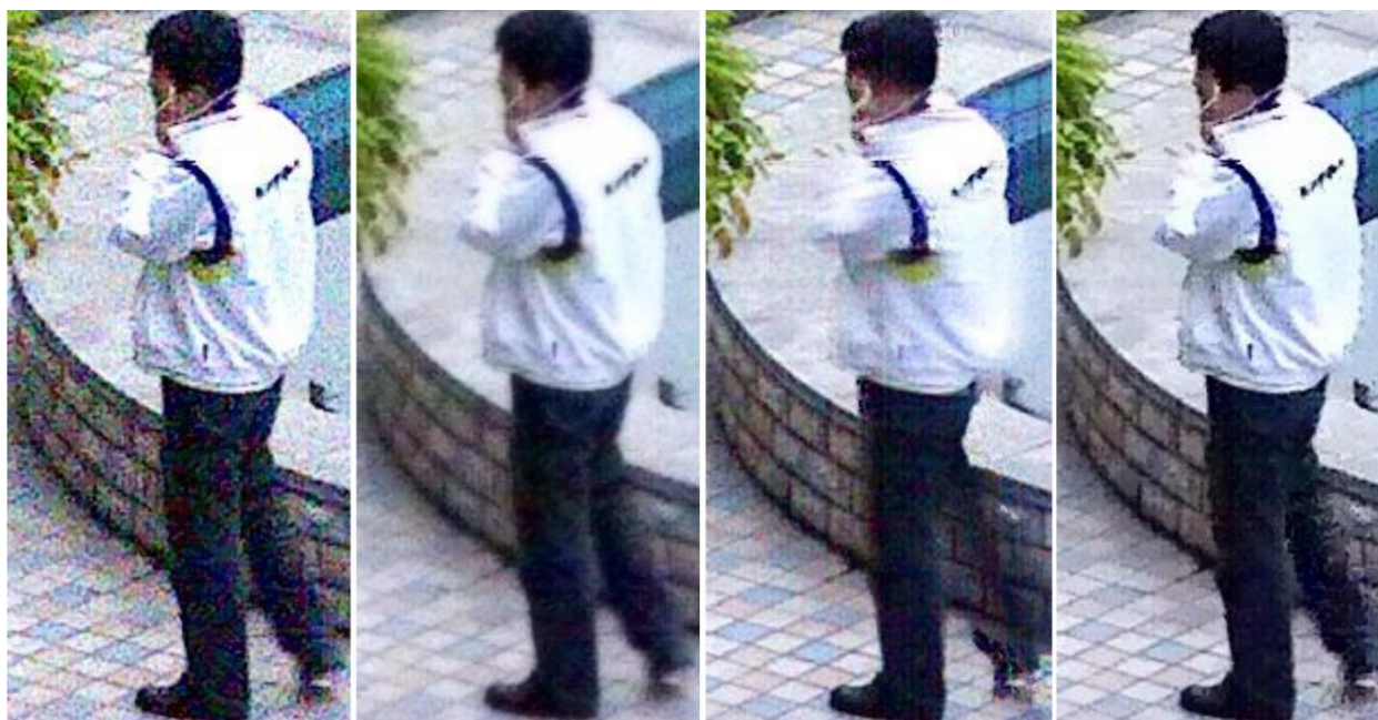
شکل ۱- از چپ به راست: تصویر اصلی، تصویر با فیلتر Spatial، تصویر با فیلتر Temporal، تصویر با فیلتر Motion Adaptive

فیلتر Motion Adaptive، از طریق مقایسه دو فریم متوالی و شناسایی ناحیه در حرکت و ناحیه ثابت، عکس را آنالیز می‌کند. فیلتر Motion Adaptive بر اساس تفاوت بین وضعیت قبل و بعد تصویر با توجه به وضعیت حرکت یا ثابت عمل می‌کند. فیلتر Temporal در بخش‌های ثابت تصویر و فیلتر Spatial در بخش‌های دارای حرکت تصویر، عملکرد بهتری دارد. در فرآیند کاهش نویز با استفاده از هر کدام از این دو نوع فیلتر در بخش‌های مربوطه می‌توان به حفظ جزئیات در بخش‌های ثابت تصویر و ایجاد سایه کمتر بر روی اشیاء متحرک در تصویر نائل آمد.